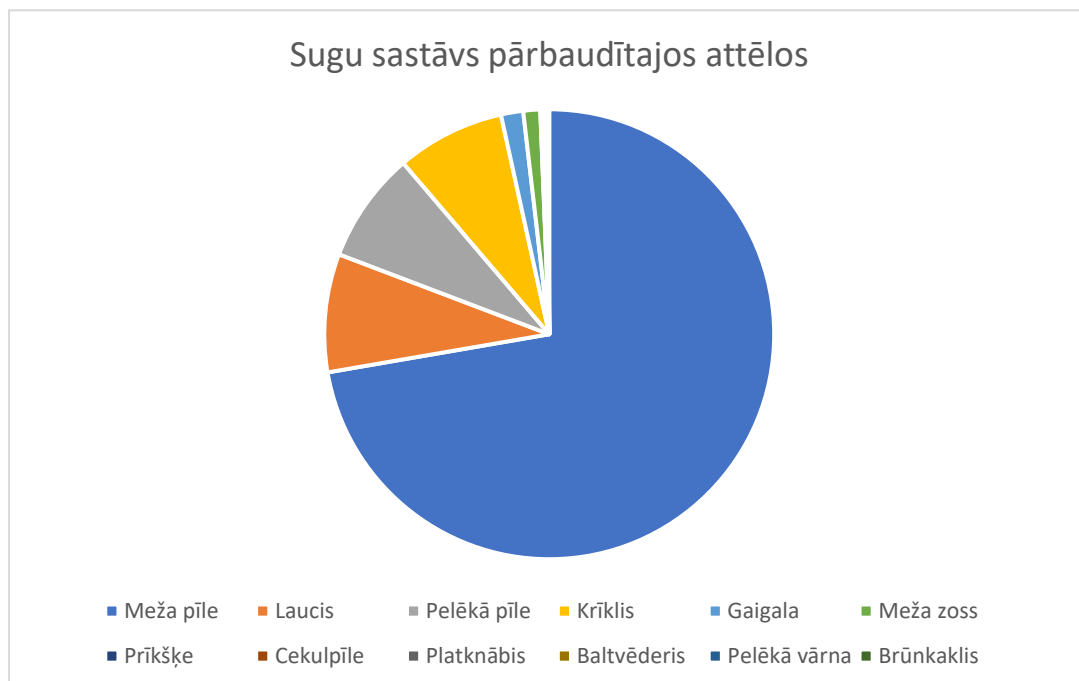
Sugu sastāvs pārbaudītajos attēlos

Laika posmā no 21. augusta līdz 4. septembrim tika saņemtas 845 fotogrāfijas ar 1573 nomedītiem ūdensputniem. No tiem sugu ar lielākām vai mazākām grūtībām izdevies noteikt 1566 putniem. Lielākā daļa no tiem (1132) bija meža pīles, kam sekoja laucī, pelēkā pīle un krīklis. 90 % gadījumu mednieku noziņotā suga sakrita ar ornitologu vērtējumu. Atlikušajos 10 % gadījumos vērtēts, ka nesakritību cēlonis bijušas grūtības putna sugas noteikšanā vai grūtības “Medņa” izvēlnē atrast pareizo putna sugu.